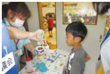
杉並小学校 放課後児童クラブでの様子

▲杉並小学校では、石岡第二高等学校の高校生ボランティアが参加し、かき氷とポップコーン作り、水風船を楽しみました。