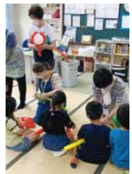
府中小学校 放課後児童クラブでの様子