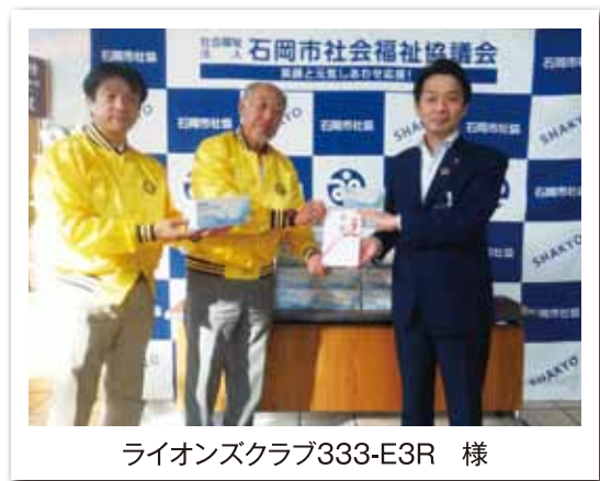
ライオンズクラブ333-E3R 様