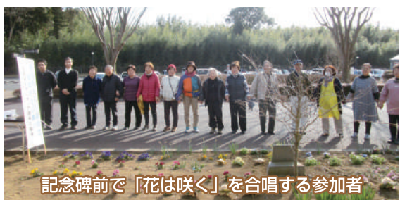
記念碑前で「花は咲く」を合唱する参加者

3月11日（土）ひまわりの館の中庭にある祈念碑前において、石岡市ボランティア連絡協議会主催による「東日本大震災鎮魂と復興祈念の集い」が開催され、同協議会の理事・会員20名が参加しました。