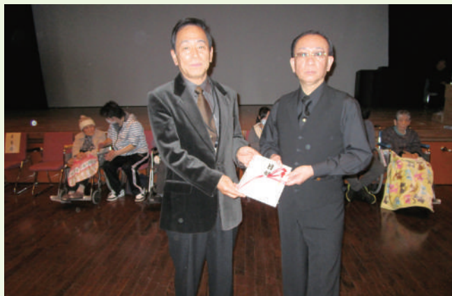
ダンシングスタジオUENO 様

◆匿名◆(有)鈴木自動車板金工場◆慈翠館◆丸谷◆ケアプランセンターかいじ◆瓦会郵便局◆協栄線材(株)