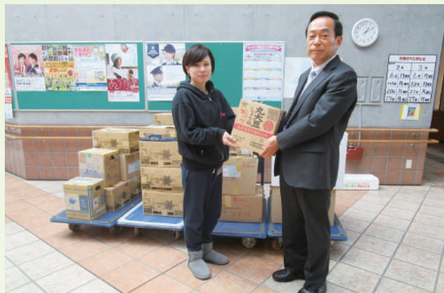
カーブス石岡杉並店 様