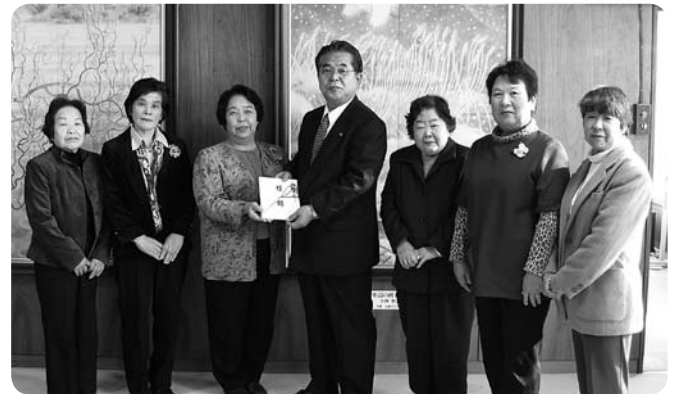
石岡市地域女性団体連絡協議会石岡地区様