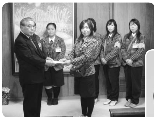
水戸ヤクルト販売(株)様