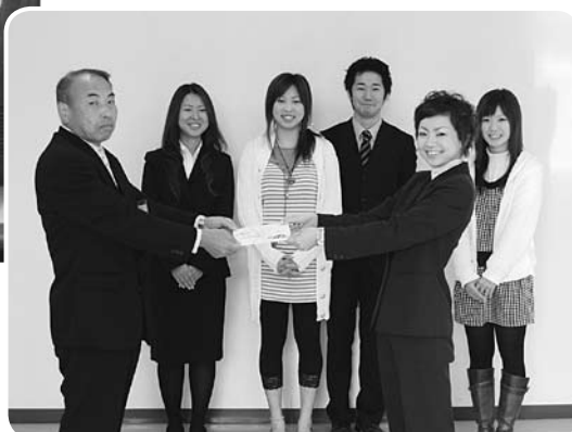
かぐらコンサート実行委員会様