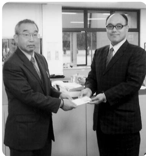
ヨークベニマル労働組合 様

心温まるお気持ちをお寄せ下さいまして、誠にありがとうございました。お預かりしました善意は、社会福祉の向上の為に活用させていただきます。