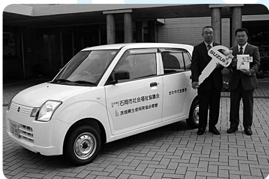
10月13日県社協にて贈呈を受けました

石岡市地域女性団体連絡協議会 テント1張 (国府地区・府中地区・東地区・ 六軒東地区・高浜地区・南台地区) 茨城県生命保険協会 車両1台