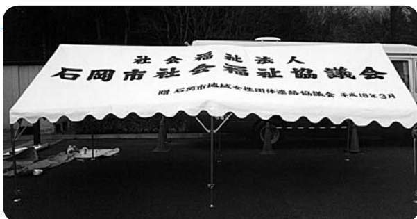
石岡市地域女性団体連絡協議会の皆さん